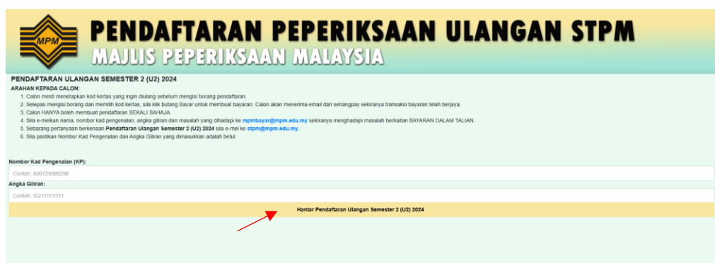
Rajah 1.1: Halaman Log Masuk.