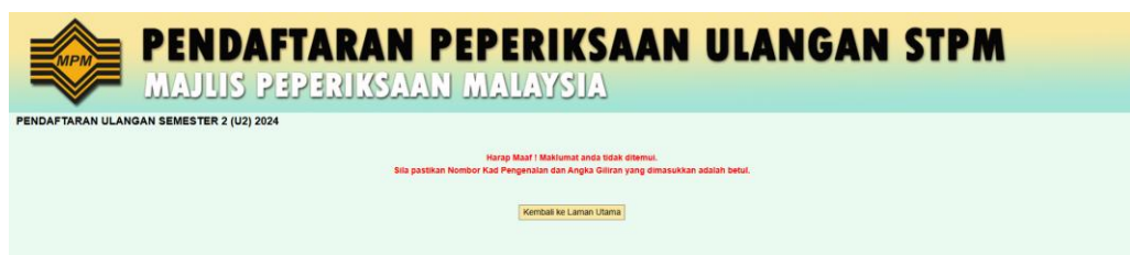
Rajah 1.2: Mesej amaran sekiranya salah memasukkan nombor kad pengenalan atau angka giliran.