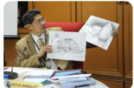
Majlis Peperiksaan Malaysia